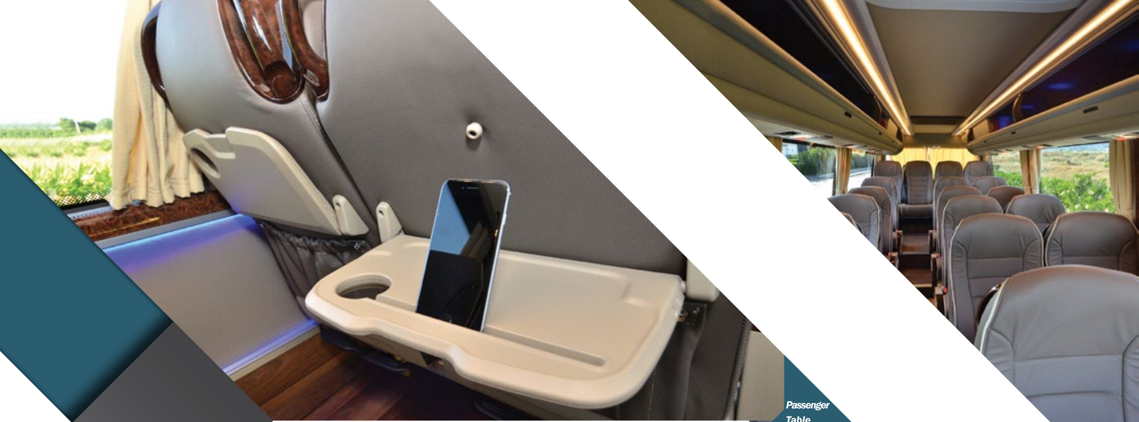
Passenger Table with I-pad Slope