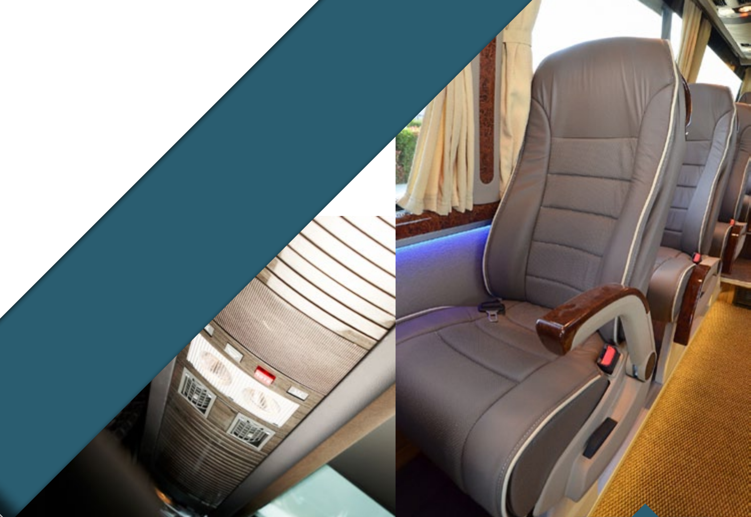
Interior Decorative Led Strip Lighting

▶ Andreas Nikas S.A. is the first greek company that specialized in the production and conversion of mini and midi buses - tourist, school, personnel & disabled persons buses.