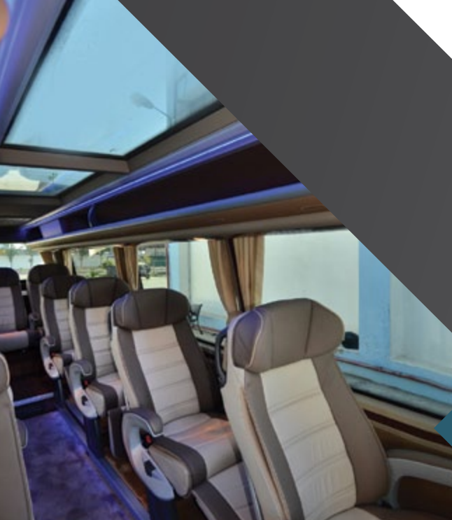
Sky View Roof